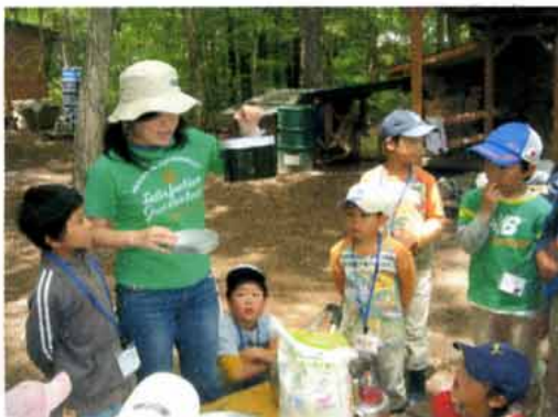
ナツキータの飯ごうの使い方講座

ゲーム終了後は、飯ごうの使い方についてナツキータから教わり、野菜を切るチームと飯ごうでご飯を炊くチームに分かれて昼食準備開始。そして、みんなでおいしいお昼ご飯をいただきました!