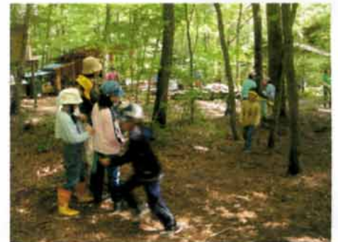
ネズミはキツネから逃げる!

そして最後は、ネズミとキツネの鬼ごっこ。天敵のキツネから逃げて生き延びるシミュレーションゲームです。すみかからエサ場まで、キツネの目をかいくぐって往復するゲームを通じて野生の生き物が生きるために必要な環境について気づいていきました。