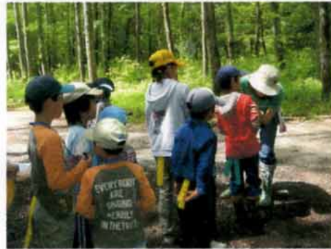
「〇個だったよ」と報告

そして最後は、ネズミとキツネの鬼ごっこ。天敵のキツネから逃げて生き延びるシミュレーションゲームです。すみかからエサ場まで、キツネの目をかいくぐって往復するゲームを通じて野生の生き物が生きるために必要な環境について気づいていきました。