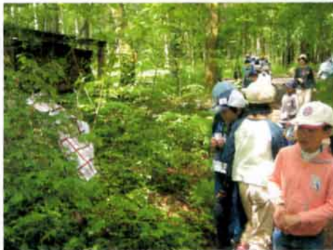
隠された人工物を探します

気分がほぐれたところで、キツネとネズミの鬼ごっこに突入!と思ったとき、スズメバチが活動予定エリアに出没!そこで急遽順番を変更して、ネイチャーゲームの自然の中の人工物を探すゲーム「カモフラージュ」をやりました。はじめは、「こんな簡単!」という余裕の表情です。ところが見つけた個数を報告しても、「まだまだ」といわれて、だんだん本気になっていきます。正解者がある程度出た時点で、みんなで答え合わせ。「あー、こんなところにあったんだ!」と、盛り上がりました。