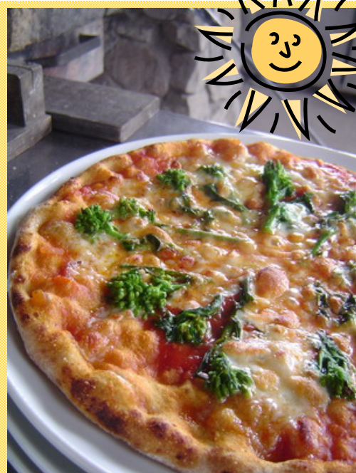
春の菜花をトッピングしてみました

普段のメニューにないオリジナルのピザを作っ て、シャロムから眺める心地よい風景といっしょに 楽しいひとときを過ごしましょう。